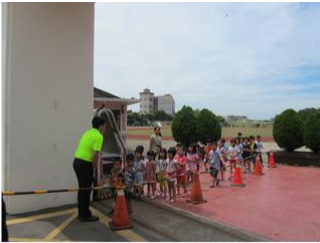
說明：一年級路隊訓練