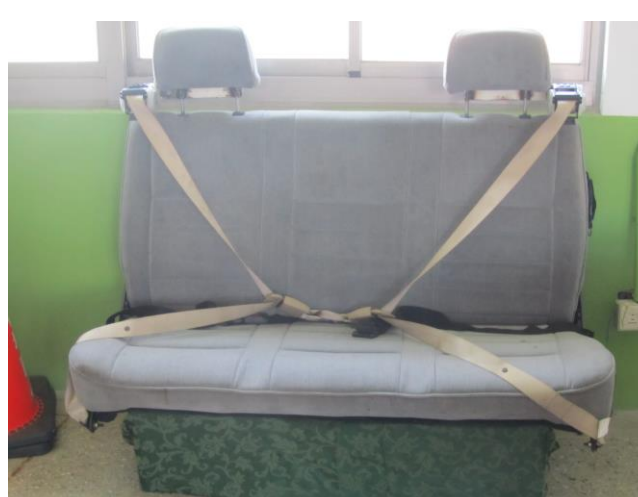
說明：製作安全帶體驗設備