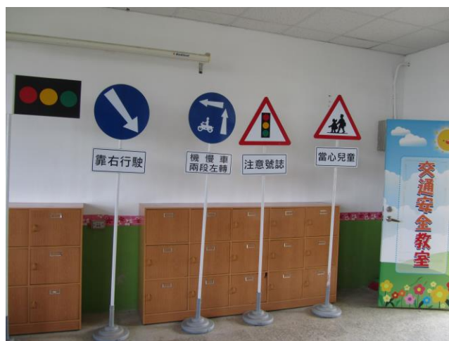
說明：製作各類交通標誌