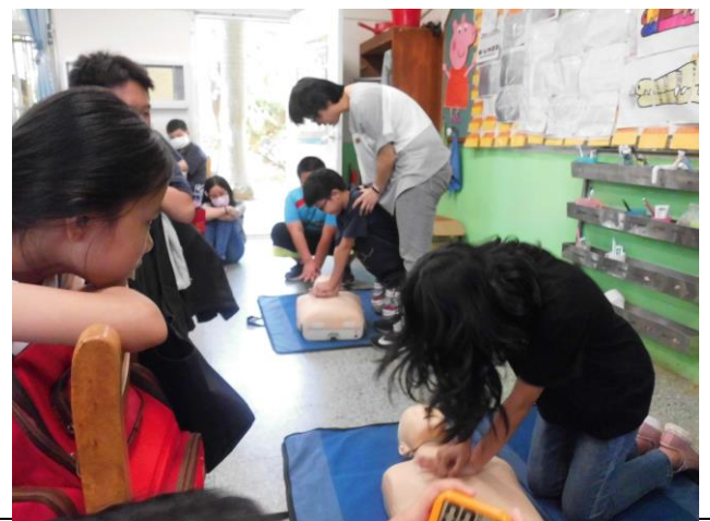
說明：六年級簡易急救訓練