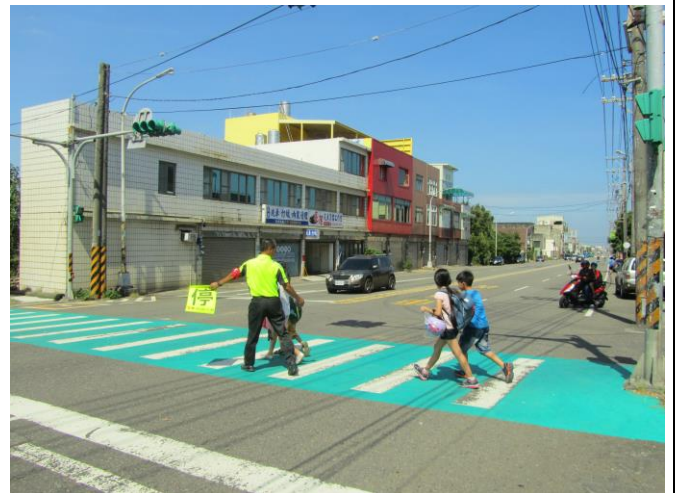
說明：四年級易肇事路況認識