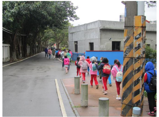
說明：二年級認識社區交通狀況