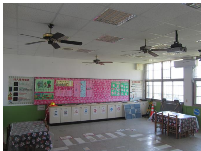
說明：設置交通安全情境教室