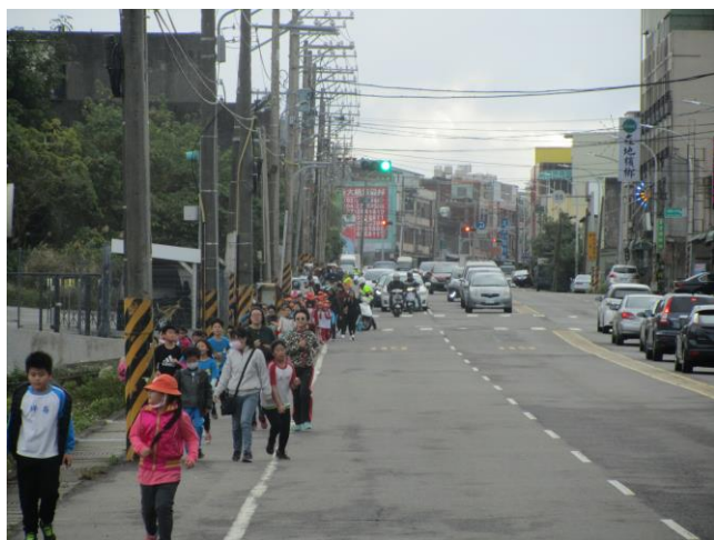
說明：路跑暨交通安全體驗