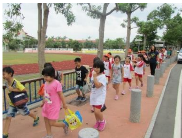
說明：社區環境踏查