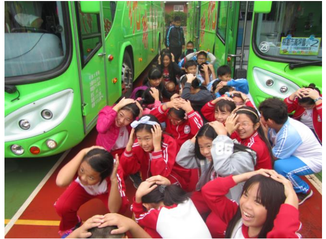
說明：校外活動逃生演練活動