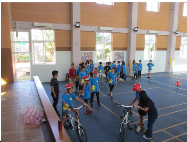
說明：五年級自行車檢定