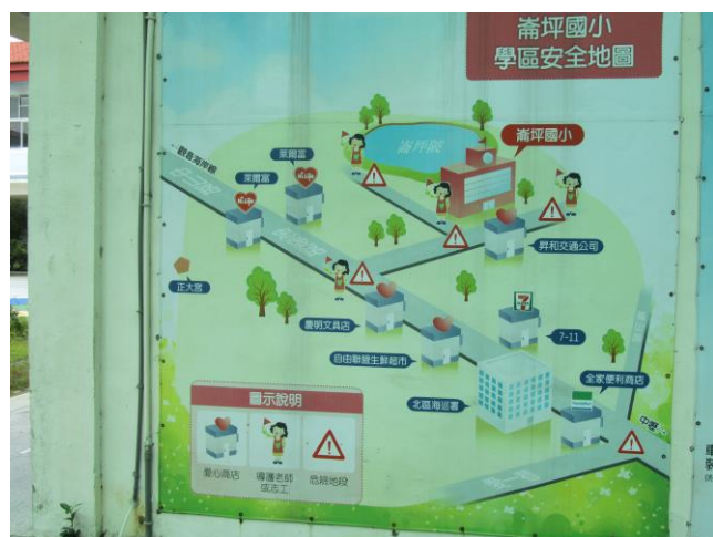
說明：學區安全地圖大型出圖