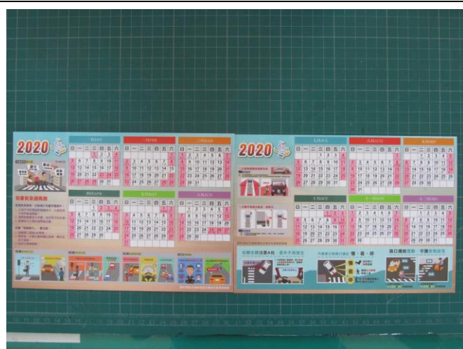
說明：製作交通安全年年曆卡