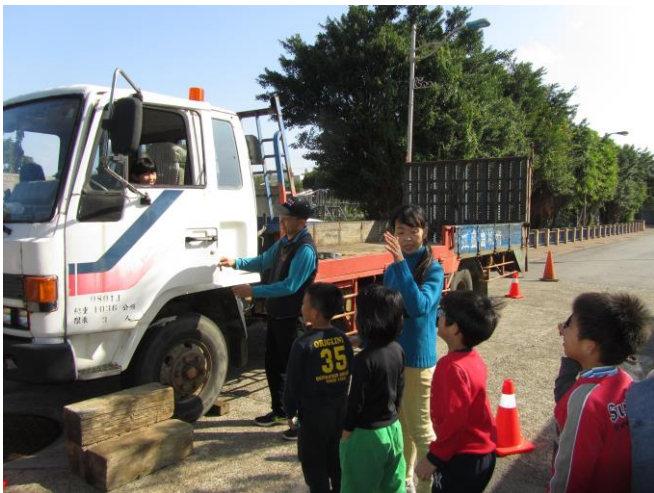
說明：三年級內輪差教學