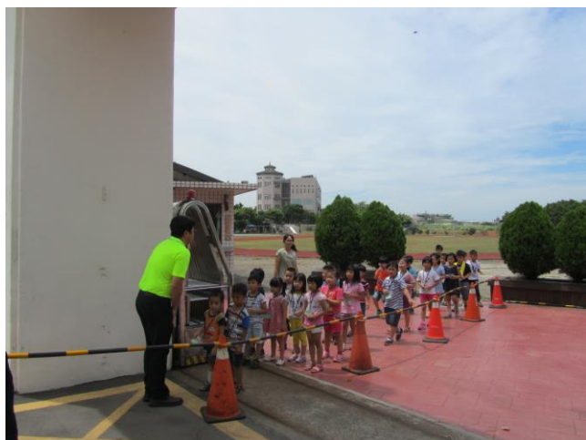
說明：小學新生活-交通安全