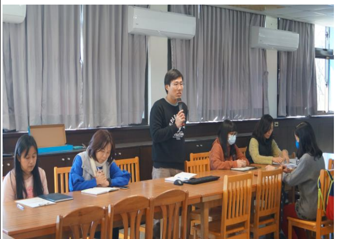
說明：行程後檢討會議